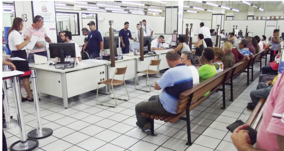
Agência do Poupatempo de São José dos Campos: lotada

Não é de hoje que o Sintaema vem expondo a situação crítica das agências de atendimento em toda a Sabesp: falta mão de obra, a defasagem é imensa perante a demanda da população