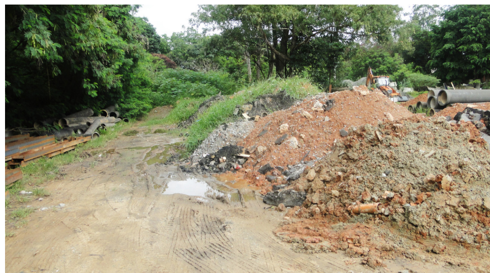
O pátio está ficando intransitável

É lamentável o que está acontecendo na Adução da Sabesp de Carapicuíba.