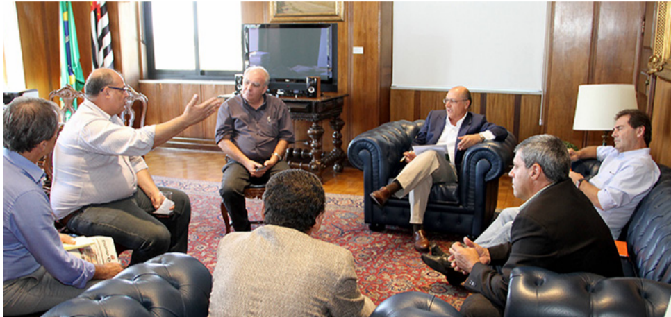
Sintaema em audiência com o governador de São Paulo

Sintaema questiona demissões ao governador, defende a manutenção do quadro atual e sua ampliação frente à crise hídrica