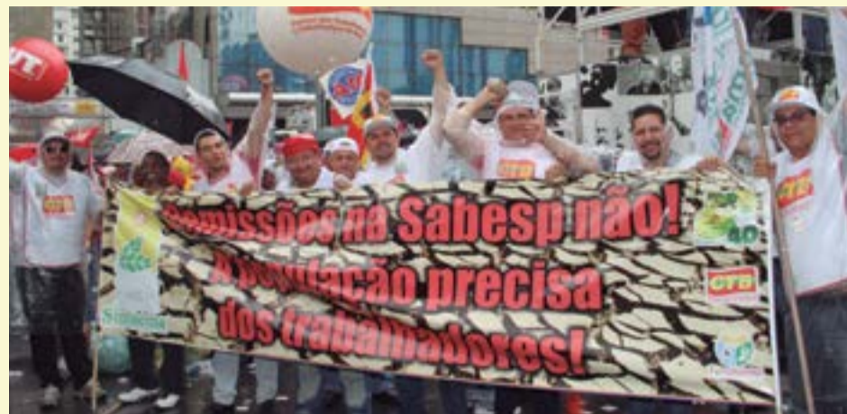
Direção do Sintaema participou do ato no dia 13 de março

Bandeiras de luta da categoria fizeram parte do ato que reuniu dezenas de milhares de pessoas que marcharam em defesa da Petrobras e da Democracia em São Paulo no dia 13 de Março