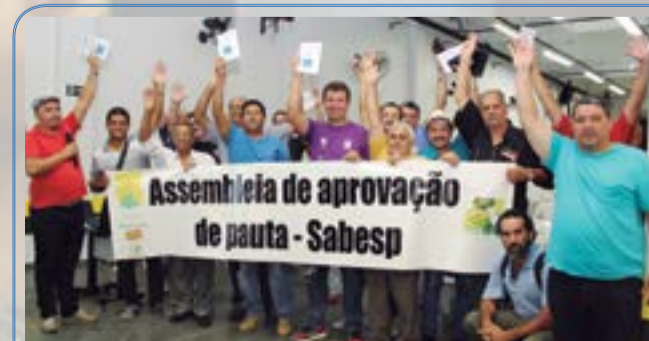
Assembleia de aprovação de pauta - Sabesp - Capital 12/03/2015