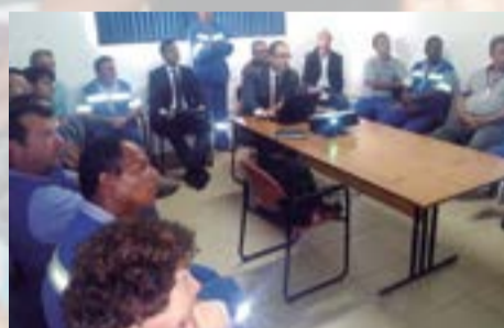
Reunião setorial em Hortolândia - Mar. 2015

Na outra setorial, em março, os trabalhadores foram esclarecidos sobre diversos assuntos, como a ação coletiva jurídica contra a Receita Federal, sobre a ação do salário regional, a ação sobre as horas extras proporcionais à periculosidade, sobre a periculosidade para motociclistas, demissões na Sabesp, PPR/PLR, crise hídrica e outros assuntos.