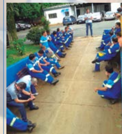
Reunião setorial em Hortolândia - Fev. 2015

No mês de março o Sintaema realizou setoriais em fevereiro e março com palestras para os companheiros e companheiras de Sabesp - Divisão de Hortolândia.