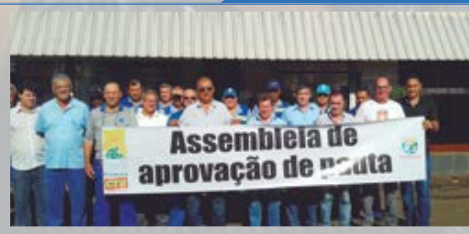
Assembleia de aprovação de pauta - Sabesp - Jales 12/03/2015