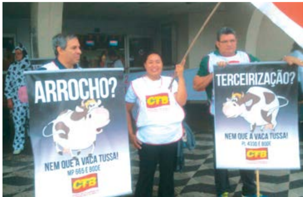
Diretores do Sintaema em protesto contra o pacote econômico no aeroporto de Congonhas, promovido pela CTB

Promovido pela CTB, o Sintaema e outros companheiros protestaram em vários aeroportos contra as Medidas Provisórias 664 e 665, que tratam do ajuste fiscal do governo federal, e contra o PL 4330, um fantasma que volta a assombrar as pautas de Brasília com seu conteúdo carregado de precarização no trabalho, visto que permite que os empregadores contratem terceiros para realizar atividades-fim da empresa. Em São Paulo o protesto se deu no aeroporto de Congonhas.