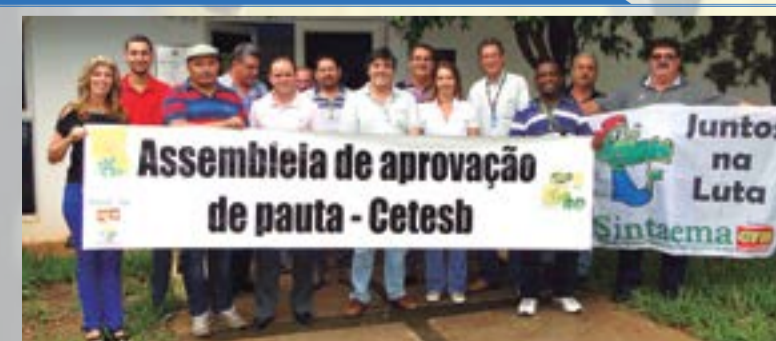
Assembleia de aprovação de pauta - CETESB Limeira 12/03/2015