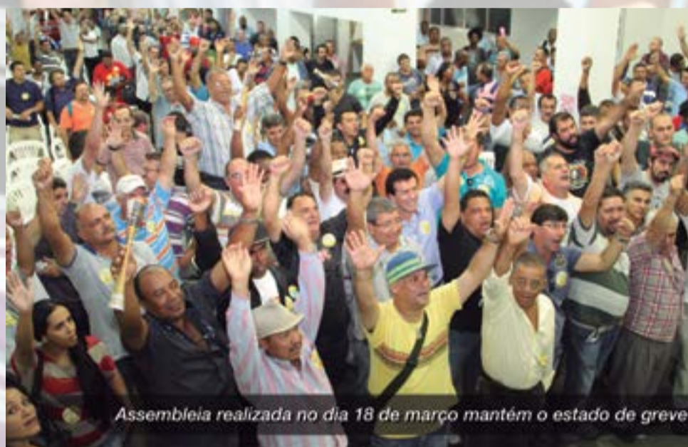
Assembleia realizada no dia 18 de março mantém o estado de greve