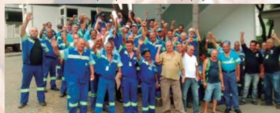
Sabesp Ato de protesto contra demissão - Polo de manutenção de São Miguel

Não é a primeira vez que o Sintaema atende o anseio dos trabalhadores e protesta devido à postura autoritária do gerente da área. Desta vez não foi diferente, o gerente da Sabesp do Ipiranga demitiu um funcionário quando este realizava exames cardiológicos. Nem ao menos no local de trabalho o funcionário estava.