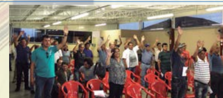
Assembleia de aprovação de pauta - Fundação Florestal 12/03/2015