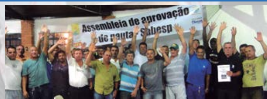
Assembleia de aprovação de pauta - Sabesp - tatuí 12/03/2015