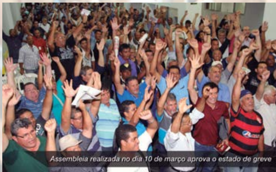
Assembleia realizada no dia 10 de março aprova o estado de greve

No dia 10 de março os trabalhadores haviam indicado greve a partir do dia 19 caso não houvesse nenhum avanço em relação às demissões, porém na assembleia do dia 18 os companheiros e companheiras da Sabesp decidiram aguardar as negociações no Tribunal.