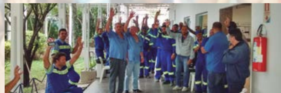
Ato de protesto pela demissão no Polo de Adução Ipiranga