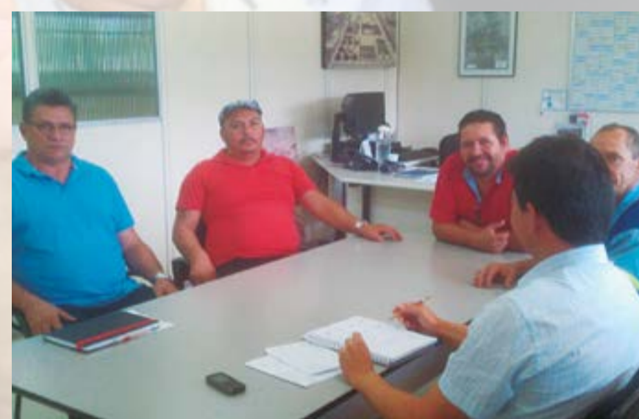
Reunião na ETE Barueri cobrando pendências

Em frente à portaria da Sabesp- ETE Barueri está um lamaçal só por causa de obras de ampliação da Estação. Além do desconforto, a lama que se forma pode causar um acidente.