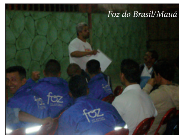
Foz do Brasil/Mauá