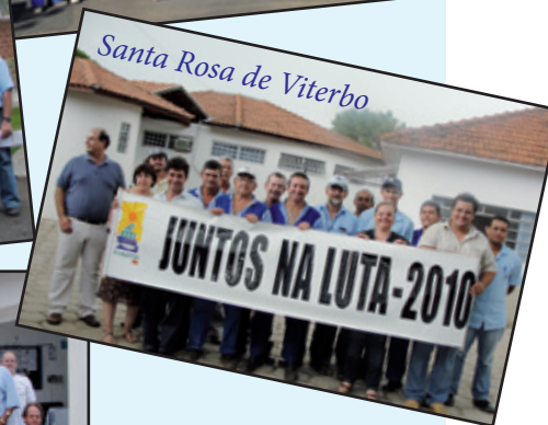
Santa Rosa de Viterbo