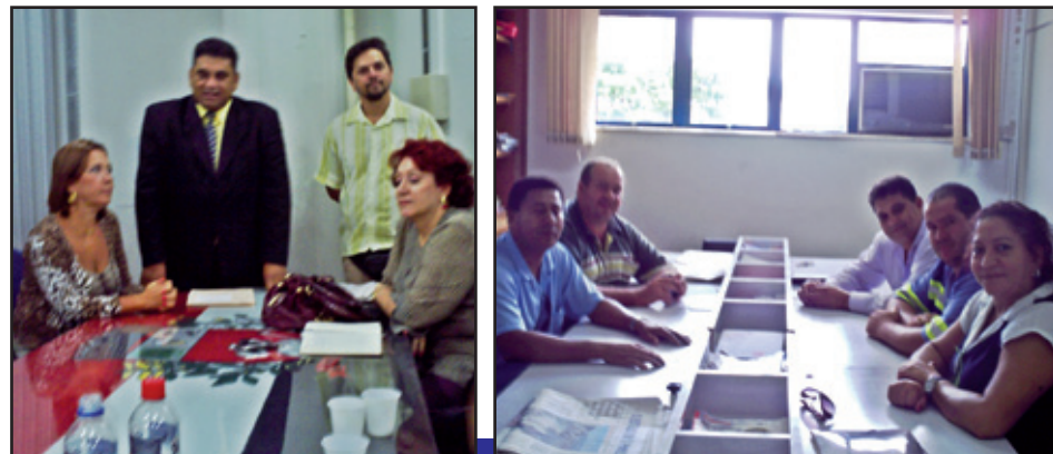
Sintaema se reuniu com autoridades de Prudente

Os vereadores mostraram-se preocupados com a saúde pública de Presidente Prudente caso não aconteça a renovação de contrato com a empresa, mas criticaram a postura da direção da Sabesp, que, segundo