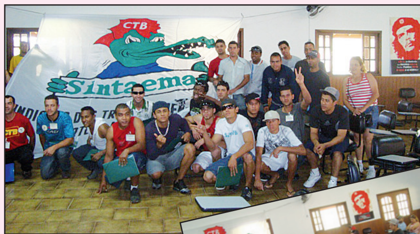
Trabalhadores da Desga e da Foz do Brasil ampliaram seus conhecimentos

O encontro propiciou o debate de temas importantes, como a finalidade dos sindicatos, a história do movimento sindical e a organização no local de trabalho.