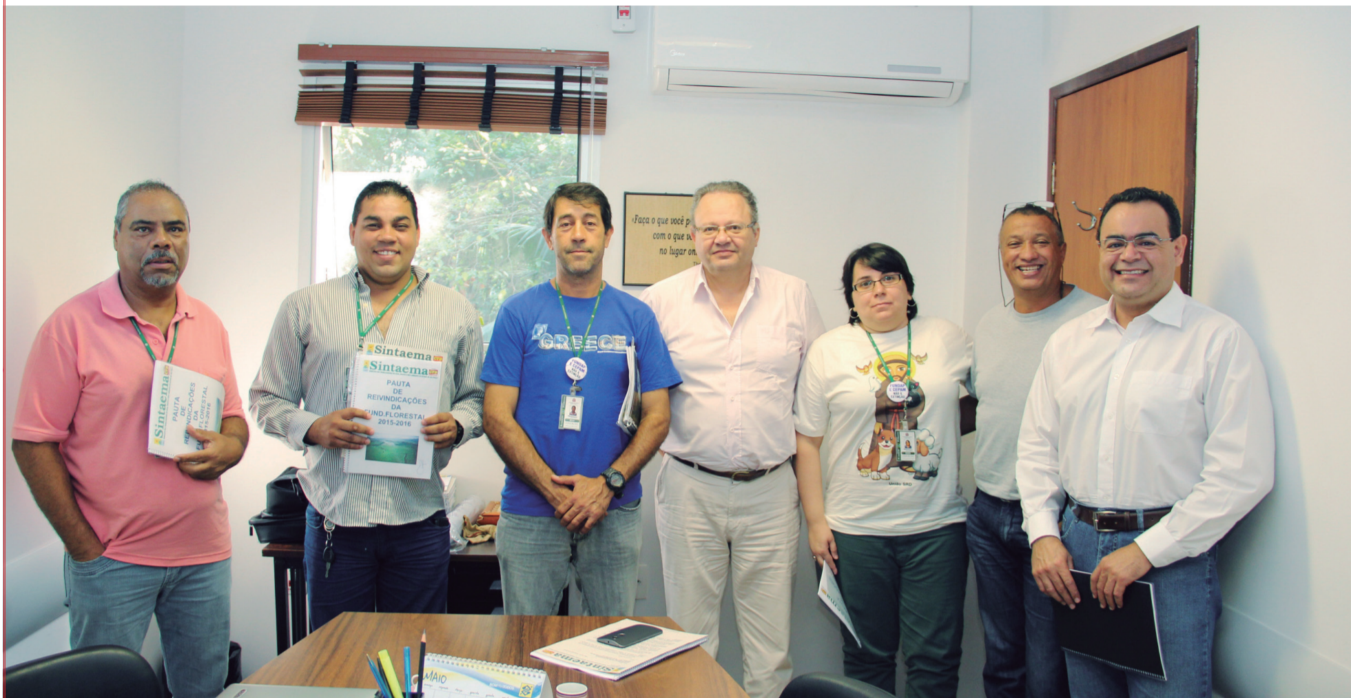
Entrega da pauta dos trabalhadores da Fundação Florestal à empresa

O Sintaema entregou as pautas de reivindicações dos companheiros e companheiras da CETESB e da Fundação Florestal, nos dias 6 e 14 de abril, respectivamente. Na Fundação, com a presença do CRF, foi colocado que as negociações começarão na segunda quinzena de maio.