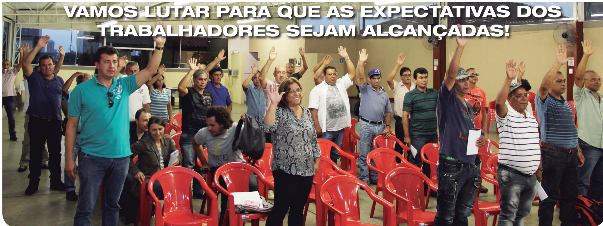
Aprovação da pauta da Fundação Florestal pelos trabalhadores do Interior