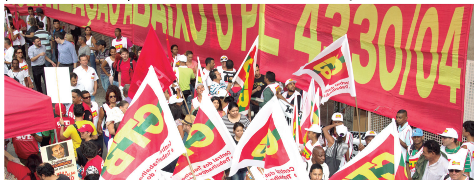
Trabalhadores em protesto em frente à FIESP, na Av. Paulista