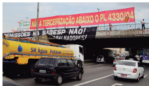
Sintaema protesta na Ponte das Bandeiras

Em decorrência da aprovação do PL 4330 as centrais convocaram para o dia 15 um dia nacional de lutas que desencadeou uma série de protestos por todo o país. Na cidade de São Paulo foram várias manifestações. O Sintaema/SP promoveu durante o período da manhã uma manifestação na Ponte das Bandeiras, no período da tarde participou na Avenida Paulista de um grande ato que reuniu milhares de manifestantes e que teve três pontos de concentração: no Largo da Batata, em frente à sede da FIESP e em frente a sede da Caixa Econômica Federal.