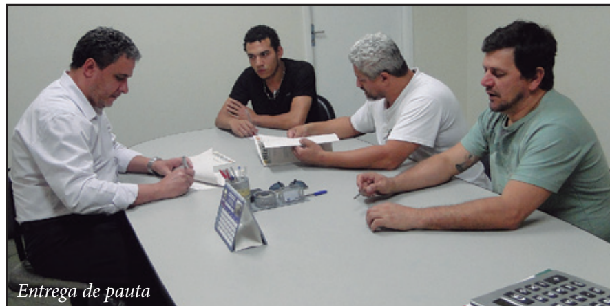
Entrega de pauta