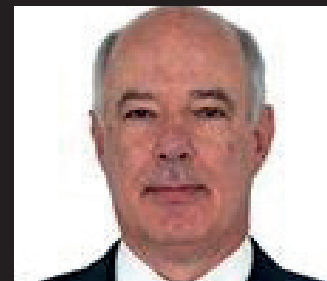
HERCULANO PASSOS - PMDB/SP