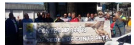
Polo de Manutenção São Miguel Paulista