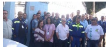
Freguesia do Ó