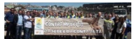
Campo Limpo e Várzea Paulista