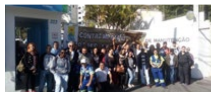
Polo Vila Maria