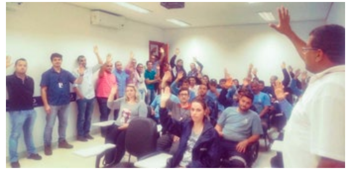
Águas de Jaú