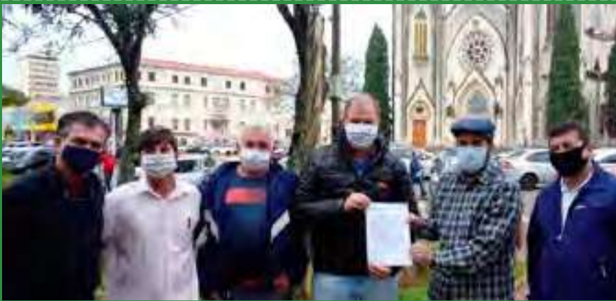
Na luta contra a privatização do saneamento, Sintaema levou carta-compromisso a candidados de várias cidades