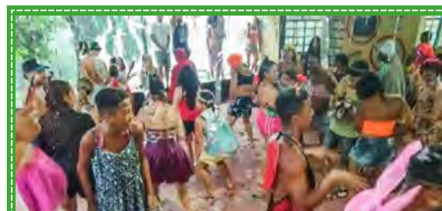
Carnaval na Colônia de Férias