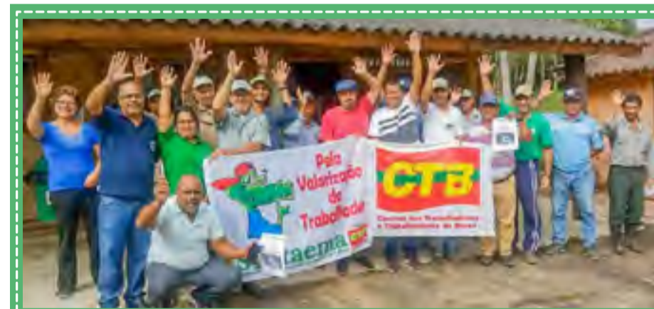
Graças à luta do sindicato e entidades ambientais, Fundação Florestal foi retirada do PL 529