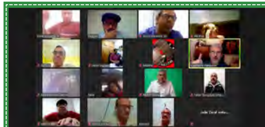
Reunião sobre o corte dos adicionais na Sabesp