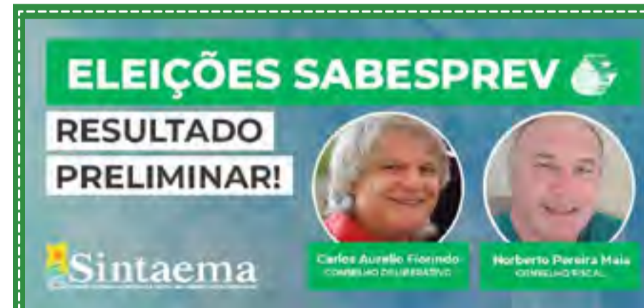
Eleições Sabesprev - Sintaema elege titular e suplente