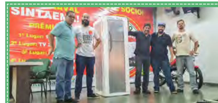
Trabalhadores sorteados na Campanha de sindicalização