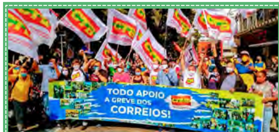
Ato contra a privatização dos Correios