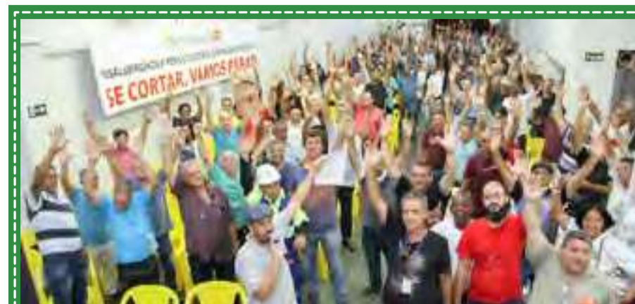
Campanha salarial - Assembleia Sabesp