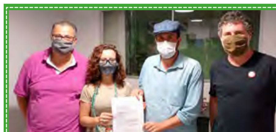
Sintaema na luta contra a privatização do saneamento firma compromisso com candidatos em defesa da Sabesp