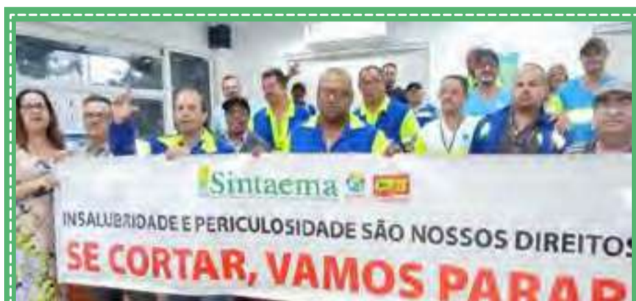
Contra o corte de adicionais na Sabesp