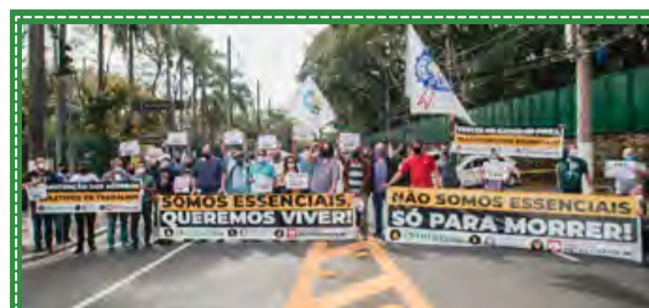
Ato em defesa dos trabalhadores essenciais