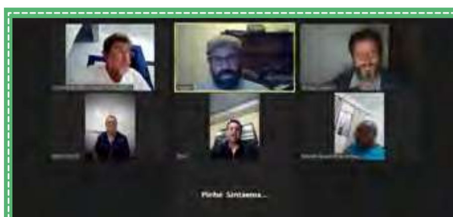
Sintaema em defesa da Fundação Florestal ameaçada pelo PL 529