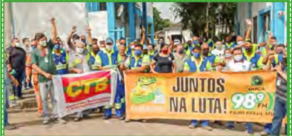
Semasa - Depois de reuniões e muitos atos, Sintaema conquista avanços para os trabalhadores