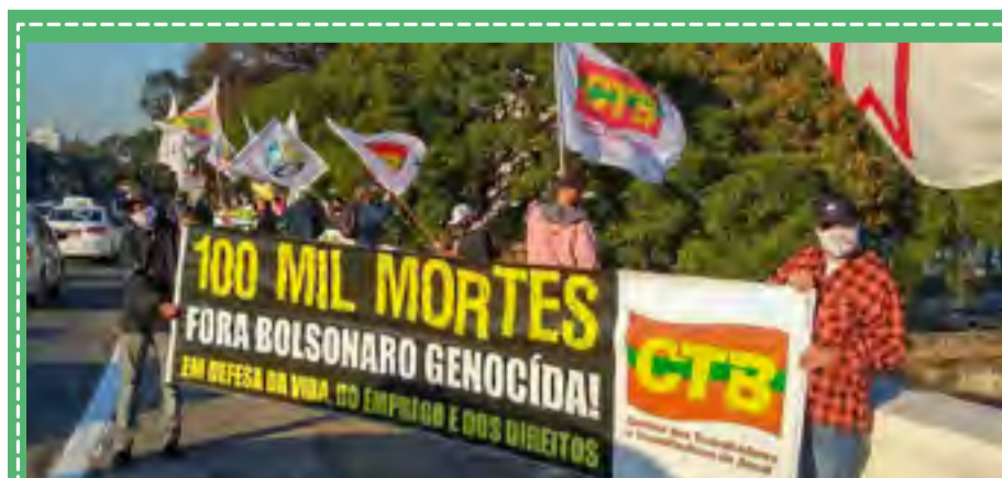
Ato contra o genocídio