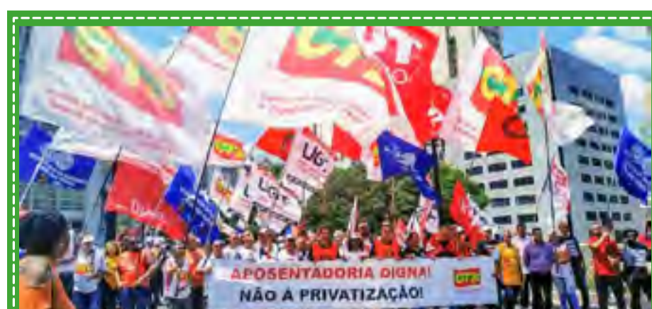
Ato contra o desmonte do INSS