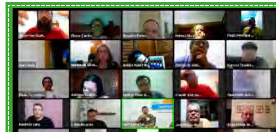
Assembleia virtual da Sabesp