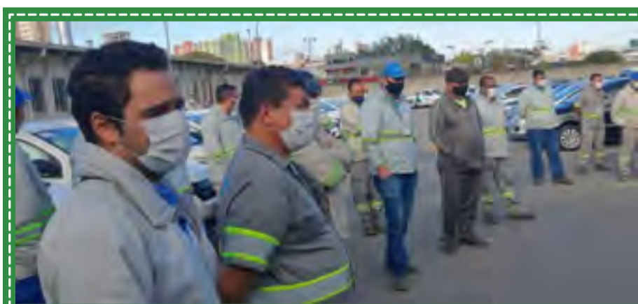
BRK Ambiental e diversas empresas privadas fecham acordo