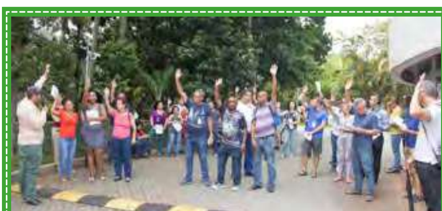
Campanha Salarial - Assembleia Cetesb