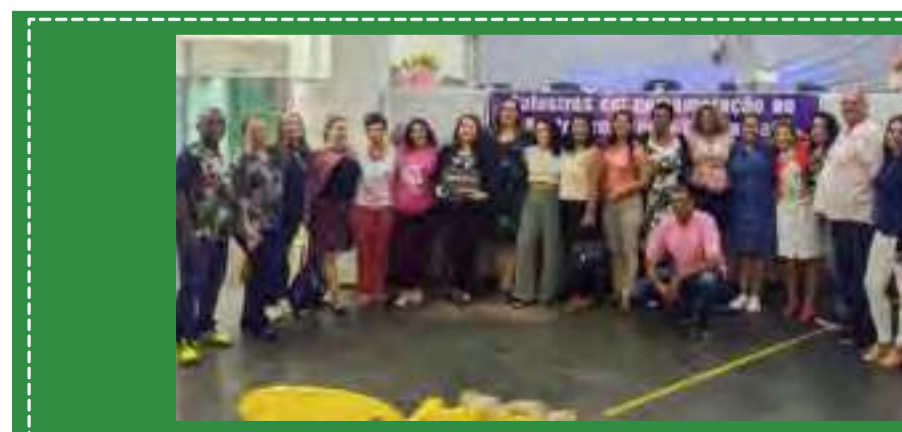
Sintaema homenageia as mulheres no 8 de Março