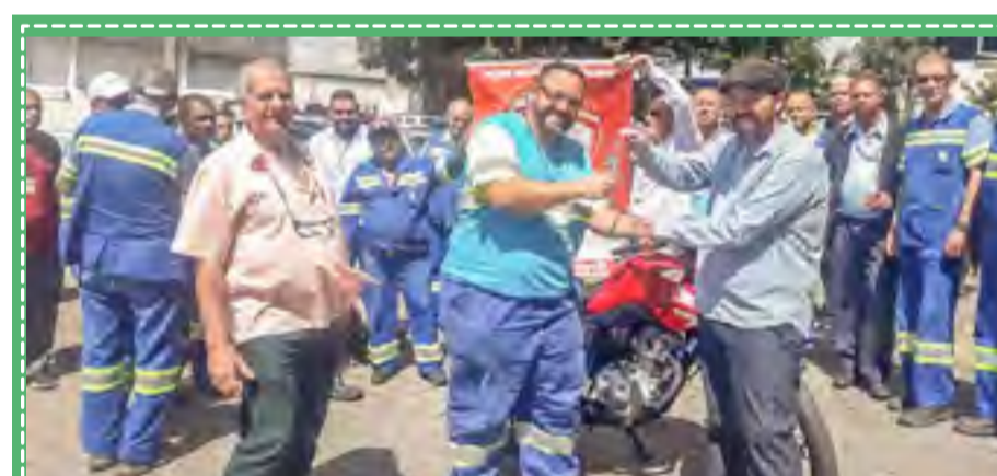
Trabalhadores sorteados na Campanha de sindicalização