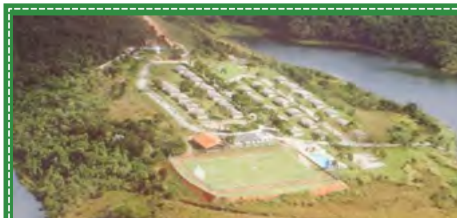
Colônia ainda permanece fechada para segurança de todos