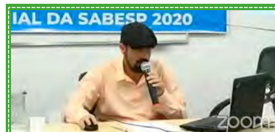
Em tempos de pandemia, assembleia virtual dos trabalhadores da Sabesp. Acordo fechado sem retrocessos