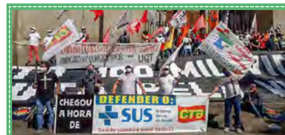
Centrais sindicais contra o genocídio