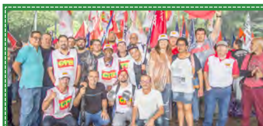
Ato contra o desemprego e em defesa dos direitos trabalhistas