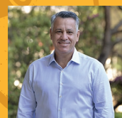
CORONEL SALLES (PSD)